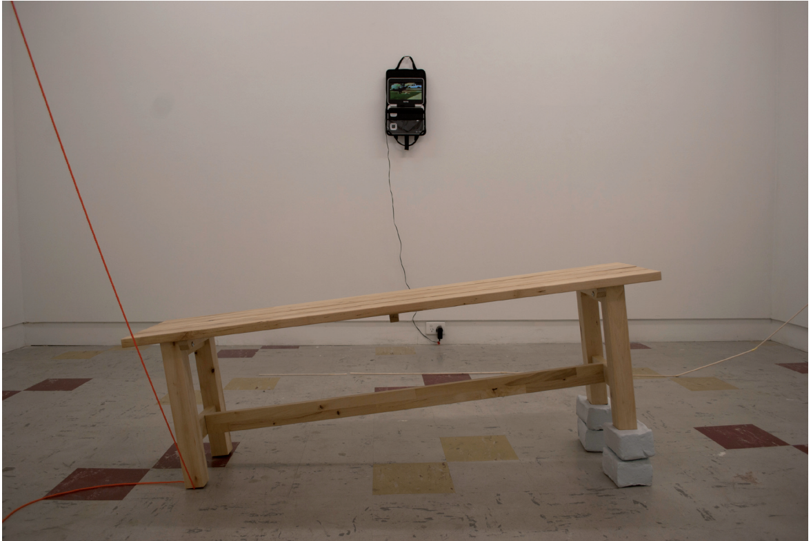
Agnes So Detalj fra installasjonen (Untitled)