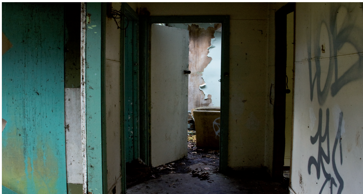
Polly Stanton Video stills fra Hallway