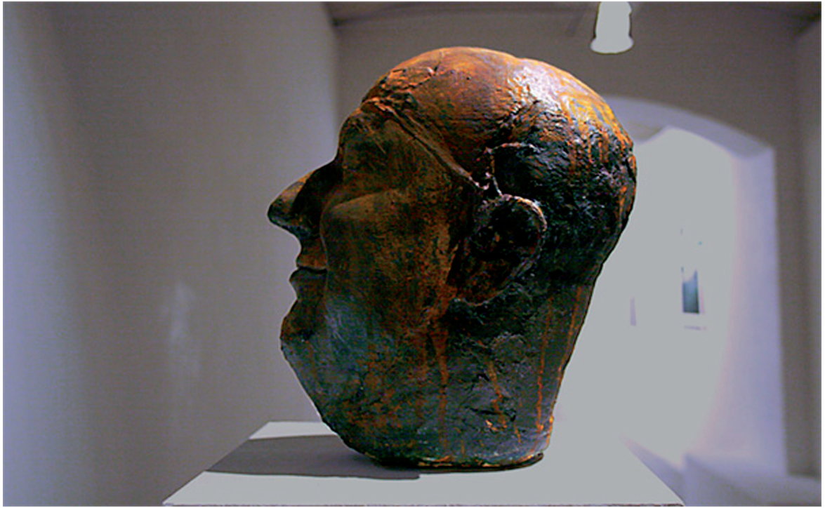
Elmedin Zunic Parallels