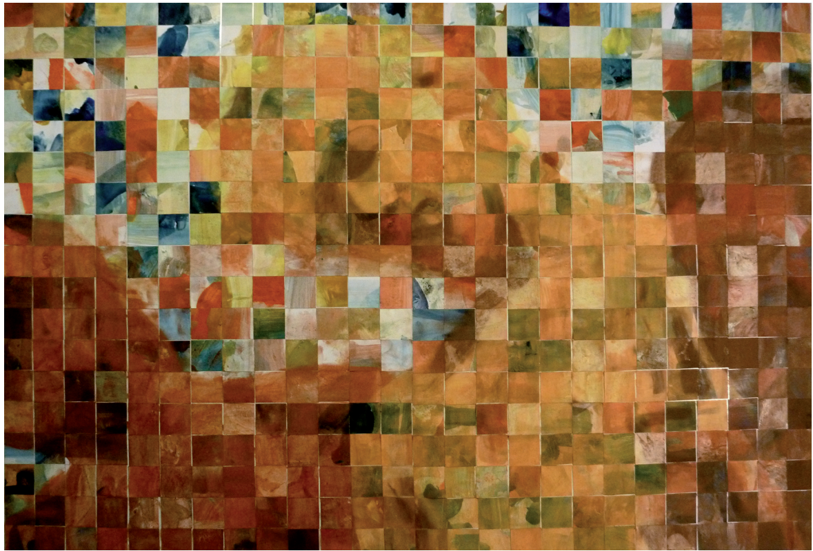
Ørjan Moen Uten tittel