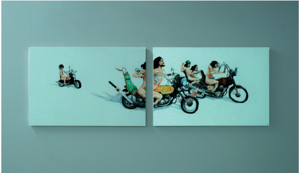
Louis Kanzo Flower Travellin Band