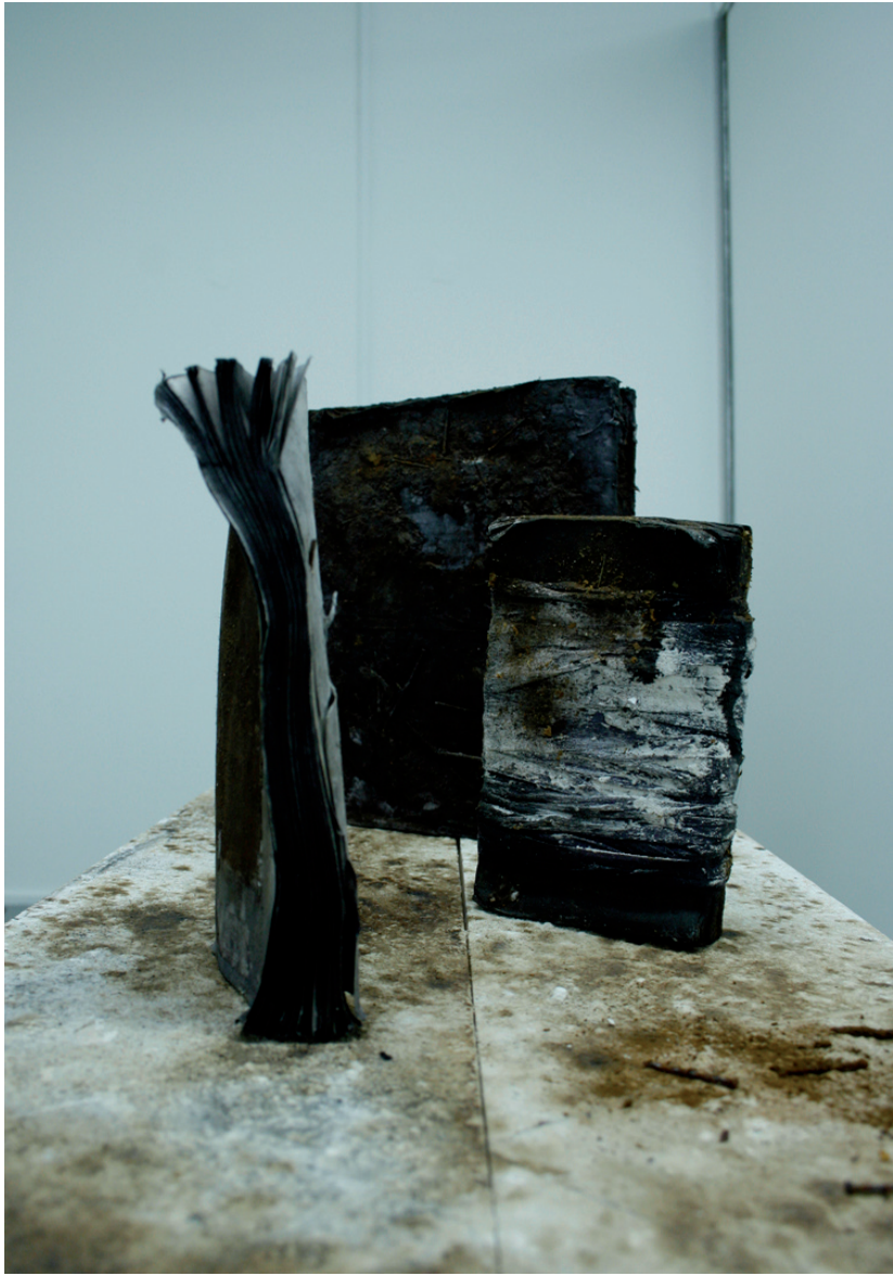
Rushdi Anwar Traces of the lost land