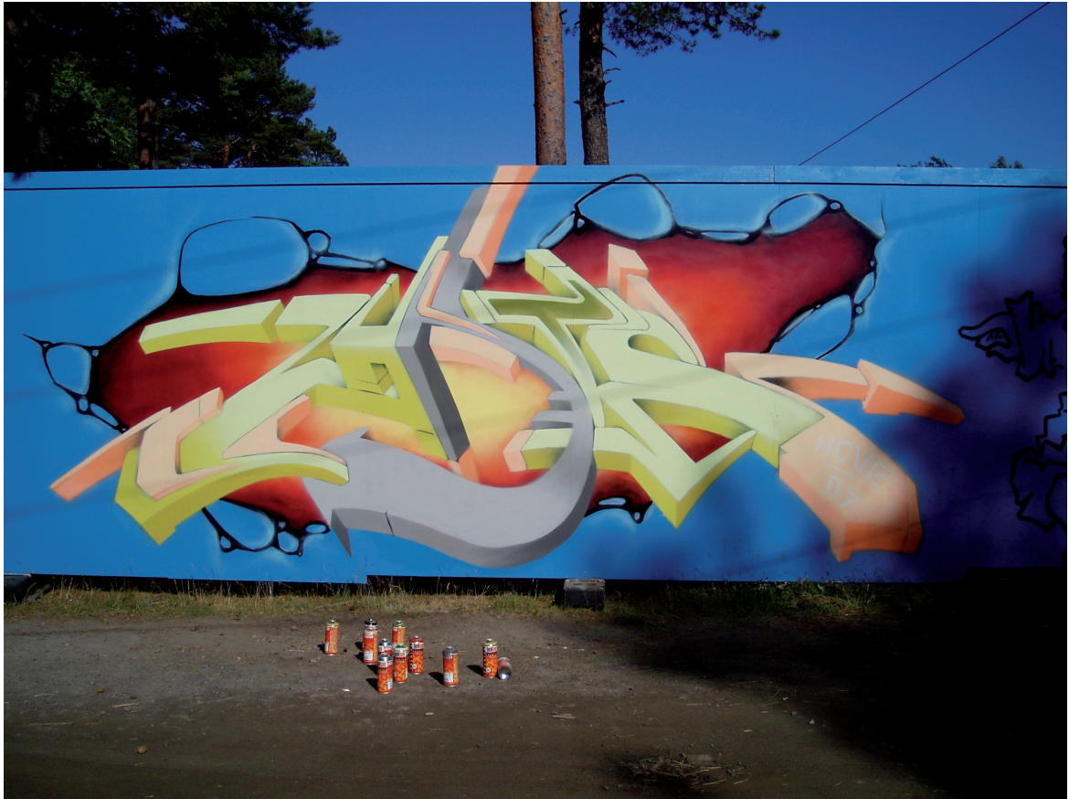
Sedin Zunic Detalj fra "veggpiece" HATS